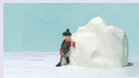
Iceberg , créadoc, 2018