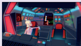
Fils de l'univers , 2018