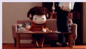
Salomé , film de fin d'études, 2019